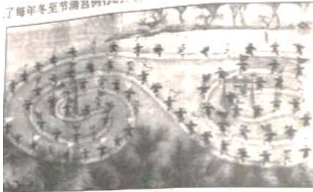
图 1 《冰嬉图》（乾隆时期）